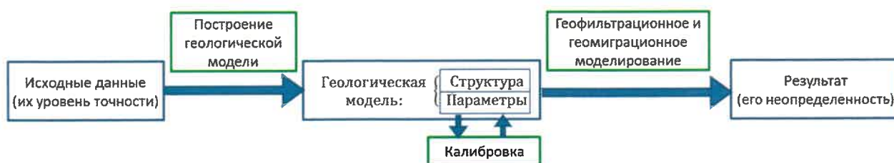
Рис. 1. Цепочка получения результата геомиграционной модели из исходных данных

Простейший подход к калибровке, оценке неопределенности и чувствительности – использование метода Монте-Карло, когда конфигурации входных параметров разыгрываются псевдослучайным образом и для каждого набора параметров из полученной выборки запускается вычислительный код [2]. В случаях, когда в силу ресурсоемкости такой подход становится неприменимым, альтернативой может служить Байесовский подход, в котором имеющиеся наблюдения используются для того, чтобы сделать выводы о неопределенности скрытых параметров [3].